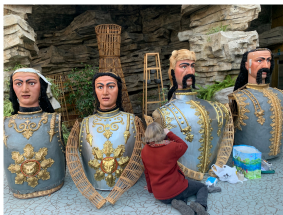
Prises de photos pour une publication Facebook.

Voir la concrétisation de mon travail, voilà ma motivation, voilà ce qui me poussait chaque jour à en donner encore plus, d'apporter encore plus d'idées.