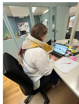
Les réseaux sociaux et moi : une grande histoire d'amour.