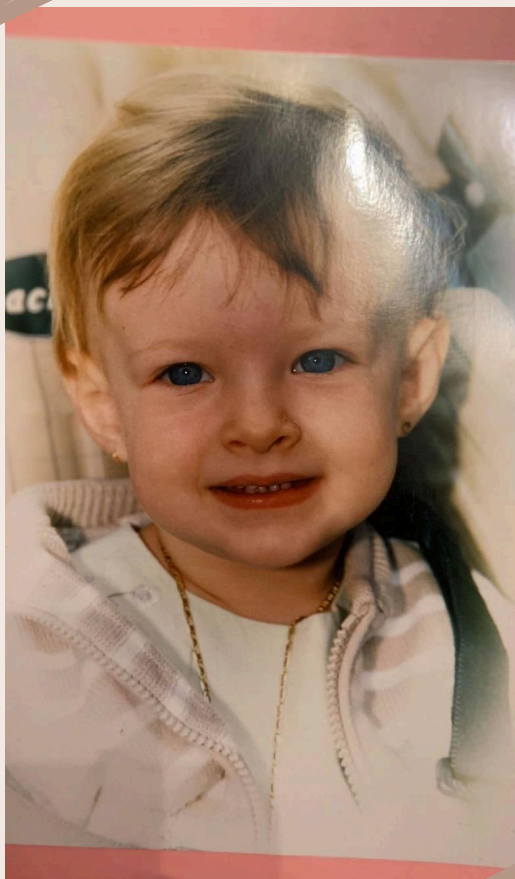
Rêveuse et souriante, j'étais déjà passionnée par l'art.

Petite, mon rêve était de devenir danseuse et de pratiquer un métier sur une scène, et même si je n'ai pas arrêté ce sport, avec le temps une nouvelle passion m'est venue, le monde de l'évènementiel. En effectuant quelques recherches, j'ai découvert les études de communication que proposait la HELHa. C'est là que j'ai compris que j'avais trouvé ma voie.