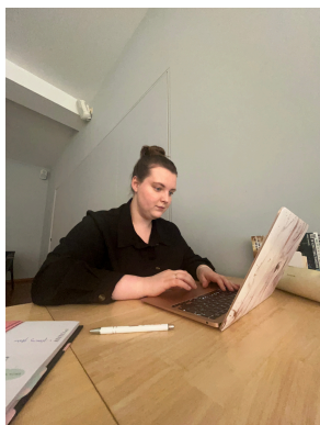
Un instant photographié lors de la réalisation du communiqué.

Je sais que j'ai pris la bonne décision en suivant mes études à la HELHa, je sors de l'école, enrichie, grandie et surtout, épanouie, pleine de compétences et de nouvelles connaissances.