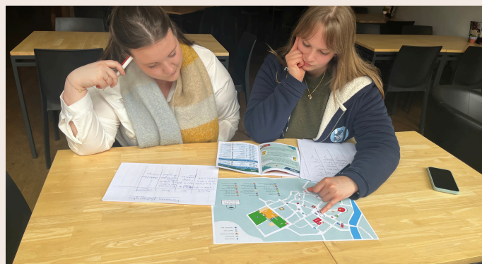
Réalisation des horaires pour les photographes bénévoles.

artistes, bénévoles, partenaires et équipe de la Maison Culturelle, durant ces 3 mois, j'ai côtoyé une cinquantaine de personnes, toutes aussi intéressantes les unes que les autres. J'ai pu découvrir ce qu'était le métier de la communication dans l'évènementiel.