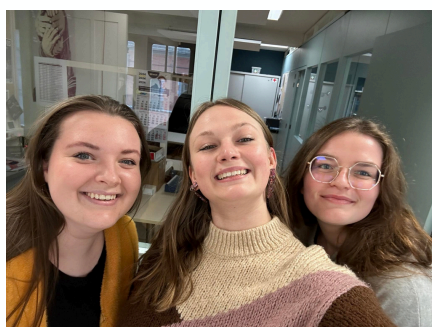
Une équipe communication attachante.